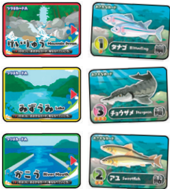
つりばカードA おさかなカード

各自、狙う魚の場所の「つりばカードB」と、 使う「どうぐカード」を決め、自分の前に裏 返して置きます。