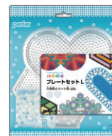
プレートセットL 六角形とハート形 (透明) ¥1,045