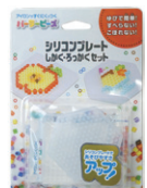
シリコンプレート しかく・ろっかく セット ¥1,760