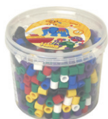
ミックス カラーボックス 基本 600P ¥1,760

アイロンビーズの元祖。Perler社よりも古く、ハマビーズのブランド名で1971年から販売されています。Mini、Midi、Maxiの3サイズがあり、Maxi (Lビーズ) は直径10mmで小さな子にもつまみやすい。アイロンをあてずに、好きな色を自由にならべるくり返し遊びや、ひも通し遊びにもおすすめです。