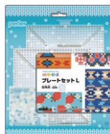
プレートセットL 四角形 (透明) ¥1,045

プレートS (四角・六角・ 丸・星・ハート) 5種類 を使って作れる、楽しい 原寸大図案が80種類