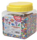
筒入り 11000P マルチカラー ¥2,420 30色のカラービーズが 約11000ピース入り

Perler社は1981年にカリフォルニアで設立。メーカーは買収などで変遷してきましたが、パーラービーズのブランド名で日本でも長年親しまれているアイロンビーズです。直径5mm。