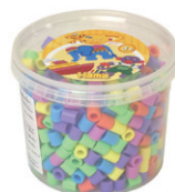
ミックス カラーボックス パステル 600P ¥1,760