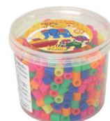
ミックス カラーボックス 透明 600P ¥1,760