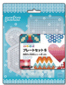
プレートセットS 四角形と六角形と ハート形 (透明) ¥660