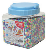
筒入り 11000P ドリームカラー ¥2,420 パステルカラー(11色)が 約11000ピース