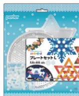
プレートセットL 丸形と星形 (透明) ¥1,045