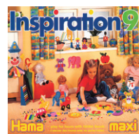
Maxi ビーズ テキストブック ¥880