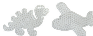
Lビーズボードパック 恐竜とひこうき ¥715