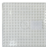
Lビーズボード 四角 (大) ¥308