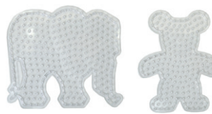
Lビーズボードパック ぞうとティベア ¥715