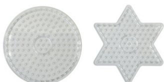
Lビーズボード 丸と星 ¥715