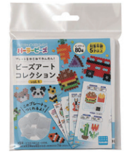
ビーズアート コレクション vol.1 ¥440

プレートS (四角・六角・ 丸・星・ハート) 5種類 を使って作れる、楽しい 原寸大図案が80種類