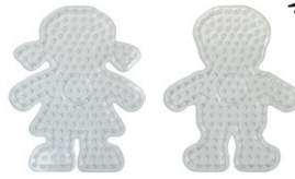
Lビーズボードパック 女の子と男の子 ¥715