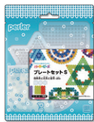
プレートセットS 四角形と丸形と 星形 (透明) ¥660