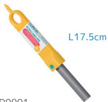
D0001 あんぜんドライバー ¥825 穴をあけ、ねじを回しやすいドライバー。4歳～