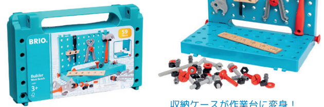
収納ケースが作業台に変身！

34587 ビルダー コンストラクションセット ¥7,150 パーツ：136ピース