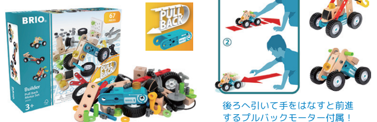
後ろへ引いて手をはなすと前進するプルバックモーター付属！

34595 ビルダー プルバックモーターセット ¥5,500 パーツ：67ピース