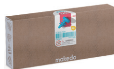
C0120 ねじ 25mm ¥2,090 120ピース入 頭部：18mmφ、ねじ部：20mm ダンボール 3～5層