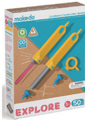
A0050 たんけんセット (初級) ¥2,860