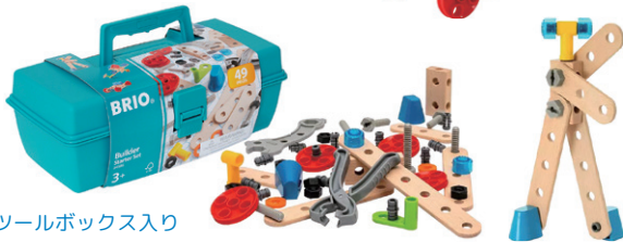
ツールボックス入り