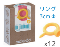
F0012 あなあけドライバー ¥825 手のひらサイズの穴あけとねじ回し。12個入。4歳～