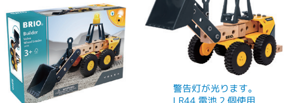
警告灯が光ります。 LR44 電池 2 個使用

34598 ビルダー Volvo ホイールローダー ¥7,150 パーツ：58ピース