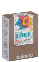
A0036 はじめてセット ¥1,045