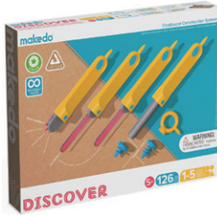
A0126 はっけんセット (中級) ¥5,720