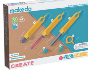
A0260 そうさくセット (中上級) ¥12,980