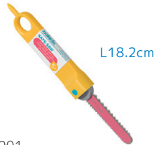
G0001 ダンボールカッター ¥1,045 ダンボールを効果的に切ることができます。刃先が丸く、子どもの小さな手にも安全です。5歳～