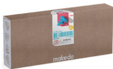
B0180 ねじ 20mm ¥2,090 180ピース入 頭部 18mmφ、ねじ部：15mm ダンボール 1～3層