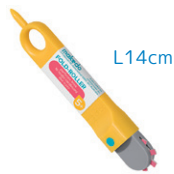
H0001 折り目つけローラー ¥1,045 ダンボールを折るための、点線の折り目を切ることができます。L14cm、5歳～