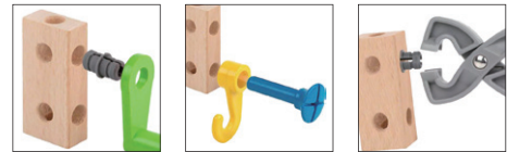
● 挿す ● 挿す ● 引き抜く

『BRIO ビルダー』は子どもたちが自由な発想で組み立てて遊ぶための造形玩具。ペンチやスパナ、ハンマーなど、道具にあこがれる3歳位から大好きな遊びです。基本のモデルを組み立てたら想像力を働かせて自分だけの作品に挑戦できます。