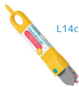
H0001 折り目つけローラー ¥1,045 ダンボールを折るための、点線の折り目を切ることができます。L14cm、5歳～