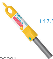
D0001 あんぜんドライバー ¥825 穴をあけ、ねじを回しやすいドライバー。4歳～