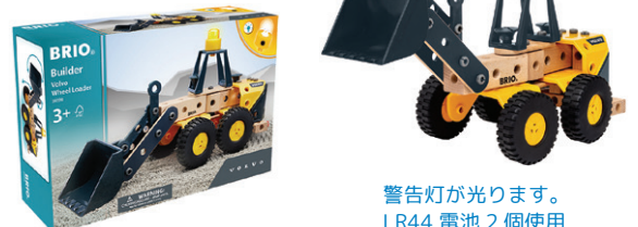
警告灯が光ります。 LR44 電池 2 個使用