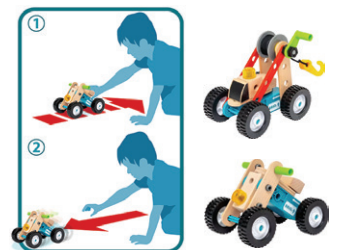
後ろへ引いて手をはなすと前進するプルバックモーター付属！