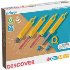
A0126 はっけんセット (中級) ¥6,600