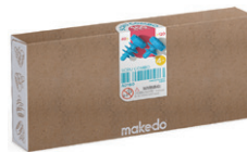
A0160 ねじセット ¥2,420 ねじ 20mm：120ピース ねじ 25mm：40ピース