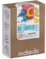
A0036 はじめてセット ¥1,045