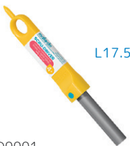
D0001 あんぜんドライバー ¥900 穴をあけ、ねじを回しやすいドライバー。4歳～