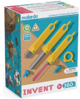
A0360 だいぼうけんセット (上級) ¥23,980