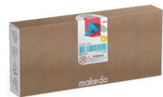
B0180 ねじ 20mm ¥2,090 180ピース入 頭部：18mmφ、ねじ部：15mm ダンボール1～3層を接合