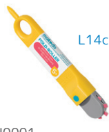
H0001 折り目つけローラー ¥1,210 ダンボールを折るための、点線の折り目を切ることができます。5歳～