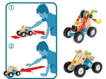
後ろへ引いて手をはなすと前進するプルバックモーター付属！

34604 ビルダー アクティビティセットII ¥11,000 パーツ：201ピース