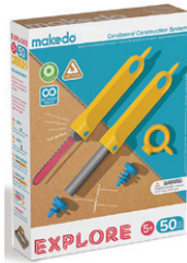
A0050 たんけんセット (初級) ¥3,300