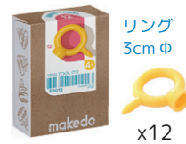
F0012 あなあけドライバー ¥880 手のひらサイズの穴あけとねじ回し。12個入。4歳～