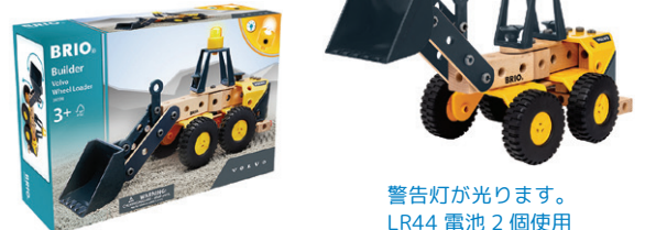
警告灯が光ります。 LR44 電池 2 個使用

34598 ビルダー Volvo ホイールローダー ¥7,150 パーツ：58ピース