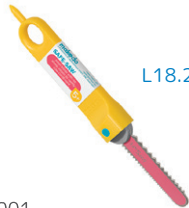
G0001 ダンボールカッター ¥1,210 ダンボールを効果的に切ることができます。刃先が丸く、子どもの小さな手にも安全です。5歳～