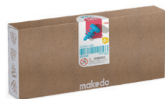
C0120 ねじ 25mm ¥2,090 120ピース入 頭部：18mmφ、ねじ部：20mm ダンボール3～5層を接合